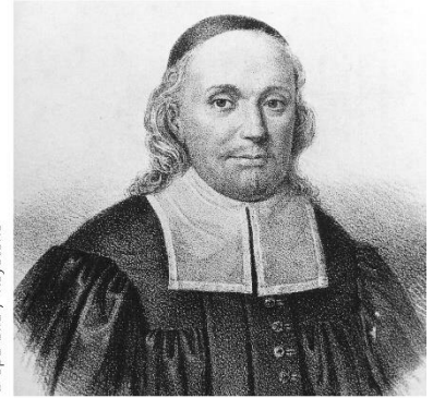
Kupferstich Paul Gerhardt (1607–1676), lutherischer Theologe und Dichter 17. Jahrhundert; aus der Bildersammlung des evangelischen Predigerseminars in der Lutherstadt Wittenberg

Eigenes Leid bleibt dem Ehepaar nicht erspart. Nach nur acht Monaten stirbt im Januar 1657 ihre erste Tochter. Drei weitere Kinder müssen die Gerhardts dann in Berlin nach nur